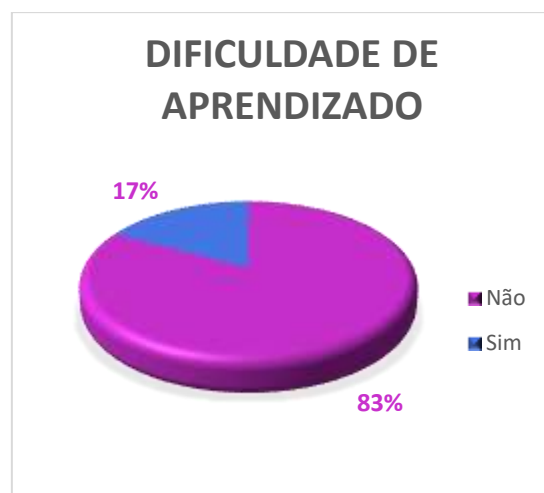
Gráfico 2: Dados ANDIFES